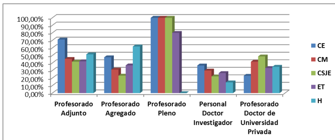
Tabla 5: Resultados favorables por campo de conocimiento y figura (%)